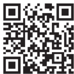
YouTube1 メディアウォッチャー